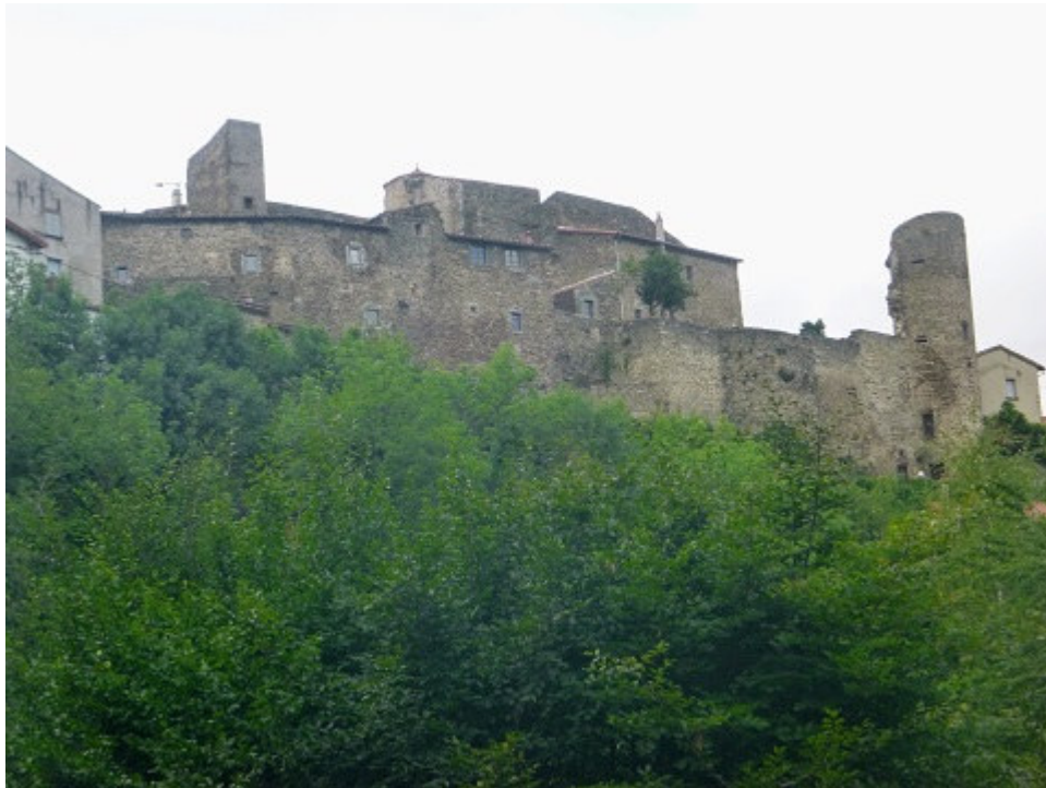
Foto: Muur en kasteel in Auzon, 3e etappe

Etappe 3B, de beklimming van de Puy Mary. Dit zou niet al te moeilijk moeten zijn: van 1000 meter hoogte naar 1589 meter en daarna enigszins constant dalen naar Aurillac met een totale afstand van 72 km. De beklimming van de Puy was prachtig. Veel vreemde bergtoppen en grillige steenklompen, door erosie gevormd en afkomstig van oude tot zeer oude vulkaanuitbarstingen (basalt, fonoliet, lava en soms gemengd met tufsteen).