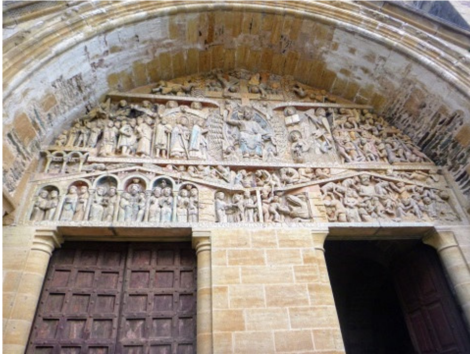
Het voorportaal met timpaan van de kerk van Conques.