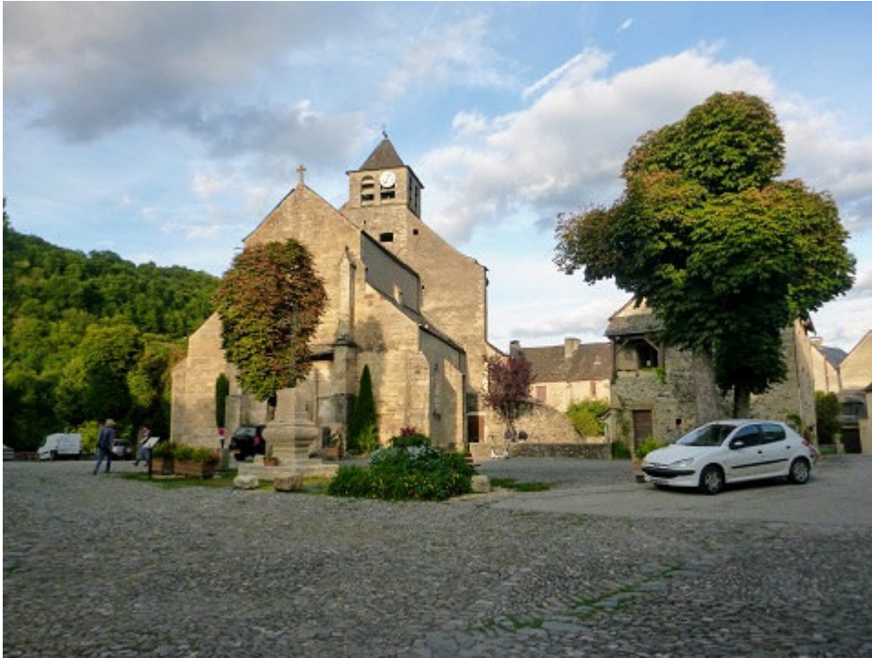
Foto: Het Romaanse kerkje in St. Eulalie d'Olt