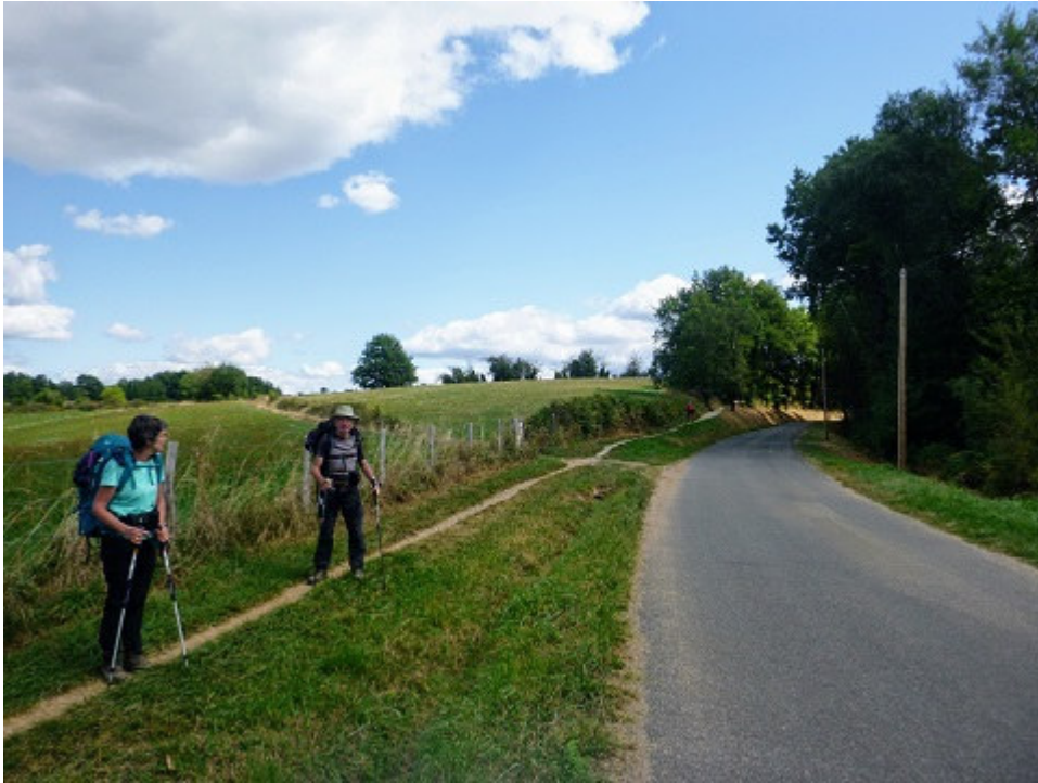
Foto: Pelgrimgangsters dichtbij Conques

Bij het plaatsje Golinhac stond 100 meter van de weg een Table d'Orientalion. Ik meende de contouren van de Puy Mary nog te kunnen zien. Ook waren de Alpen aangeduid, maar het weertype was niet glashelder.