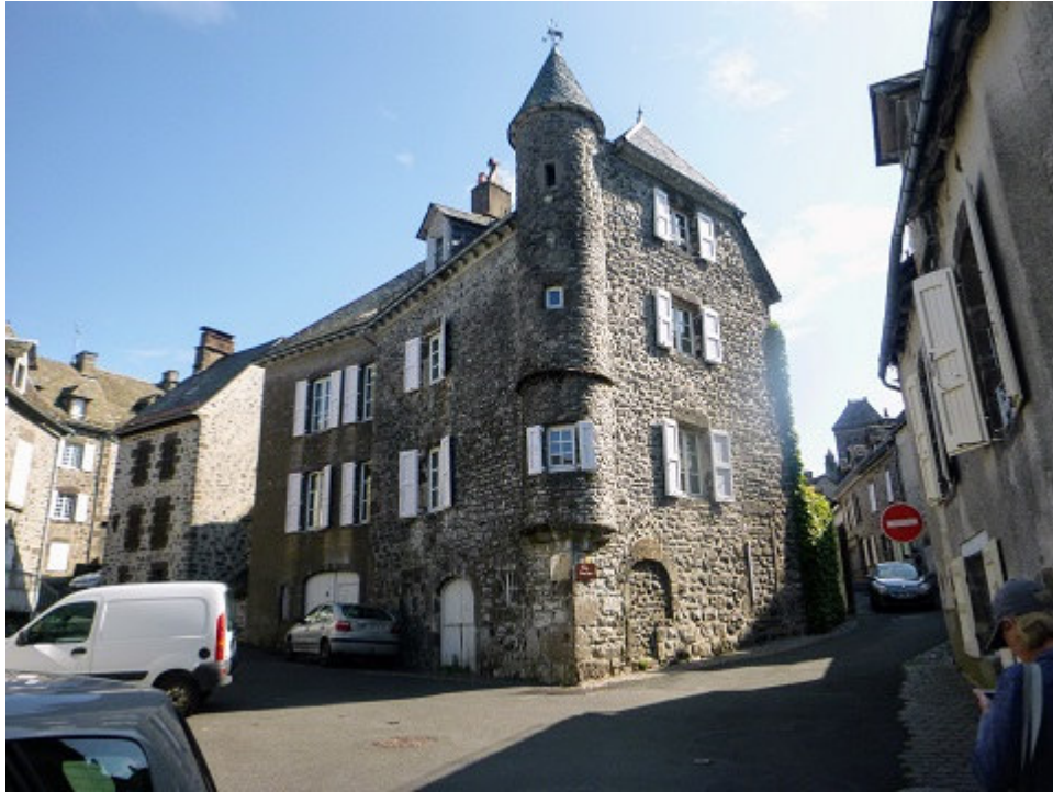
Foto: Huis van basaltblokken in Salers, dichtbij de Puy de Mary

De 4e etappe: 135 km lang, weinig grote beklimmingen naar St. Geniez-d'Olt. Het landschap kwam erg overeen met de Ardennen vond ik, met ook veel mooie, gezellige en soms Hans en Grietje-dorpen of stadjes. Gezien de lengte van de etappe was ik vroeg vertrokken: om 09 hr. Het eerste gedeelte viel mij al erg tegen, ik zat na 4 uur bij het dorp Conques op een gemiddelde van slechts 15 km!! Dat was eigenlijk niet zo mooi. In Conques staat een beroemde, Middeleeuwse kerk uit de 11e eeuw, met een fraai timpaan. Zie foto.