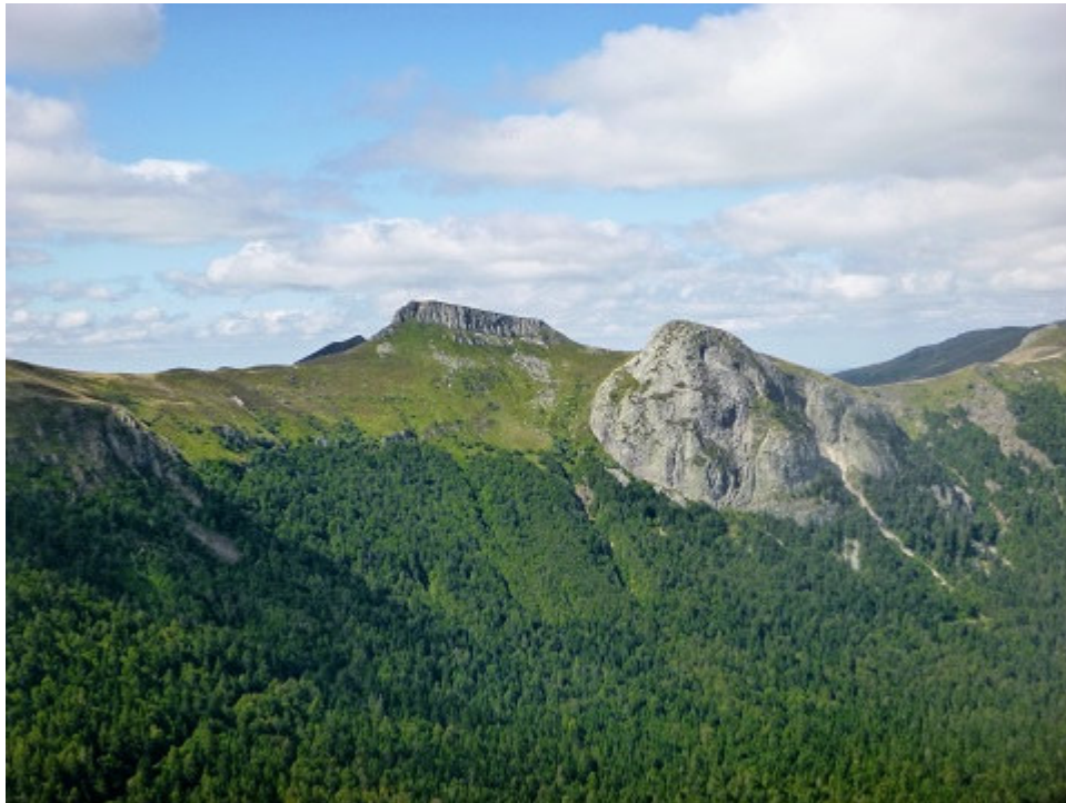
Foto: Een paar zeer grote rotsklompen op de Puy de Mary