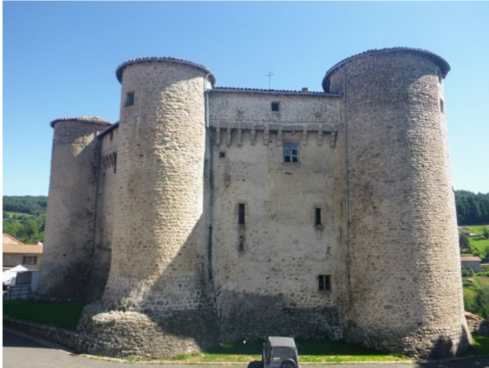
Foto: Rudimentair kasteel in Chalmatel, 2e etappe

Nu bij het ontbijt, keek ik op internet naar pijn op de borst, kwam bij de thuisarts.nl terecht, en het viel allemaal reuze mee!!! Er waren ca 6 onbenullige oorzaken voor die pijn, en er was inderdaad 1 vervelende oorzaak door hartproblemen, maar dan moest je je zweterig, zwak en koortsig etc. voelen. En dat had ik niet, dus samen concludeerden wij dat er NIETS aan de hand was! Waarschijnlijk waren er wat spieren verrekt, door de overmatige inspanning van de vorige dag. Op dit moment viel er nog wat regen, maar dat zou om 9 uur stoppen. Ik had de originele 3e etappe veiligheidshalve thuis al in tweeën geknipt, want die was ca 150 km lang met 2000 hoogtemeters! Dus had ik nu maar 83 km te gaan, en als ik uiterlijk om 11 uur zou vertrekken, had ik nog voldoende tijd om de camping in Allanche te bereiken.